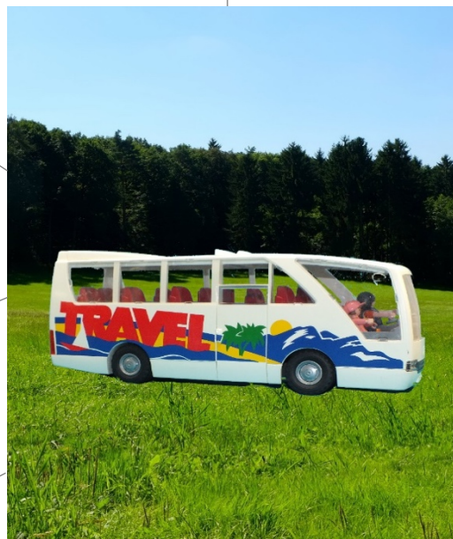
Tina sitzt im Bus