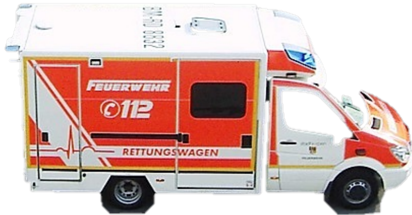
● der Krankenwagen