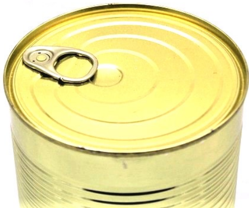
● die Konservendose