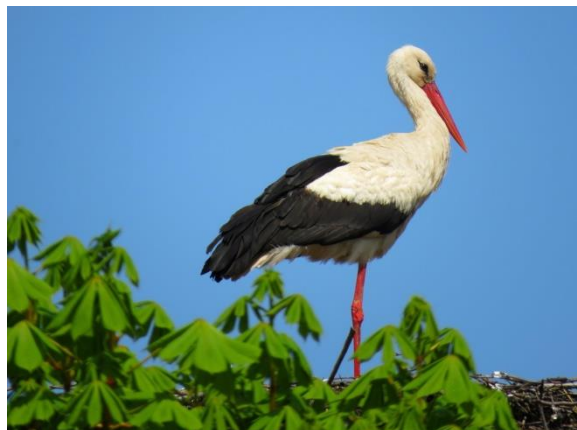
● der Storch