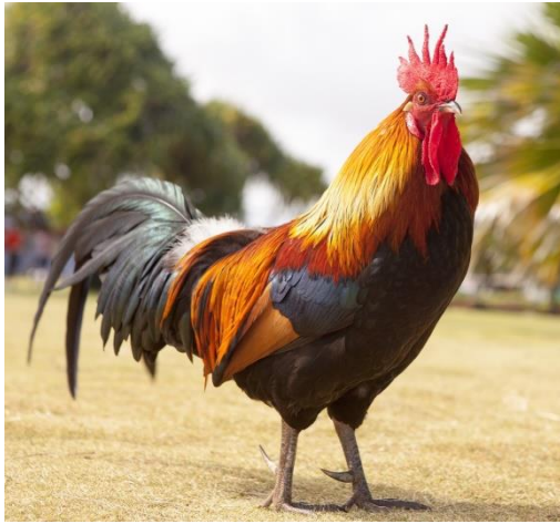
● der Hahn