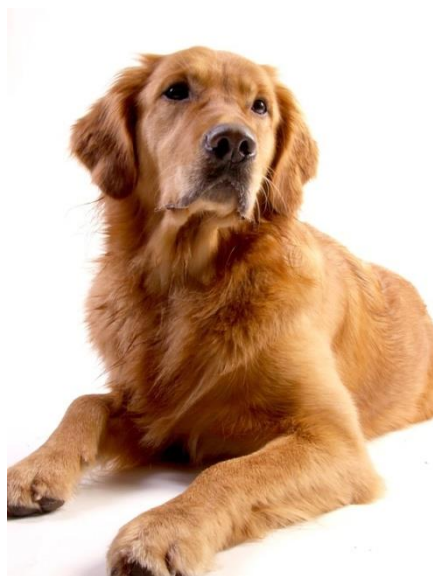
● der Hund