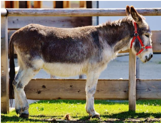
● der Esel